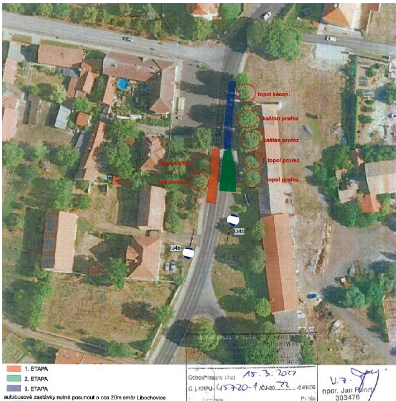
Příloha č. 1 k ODSH 24078/2022